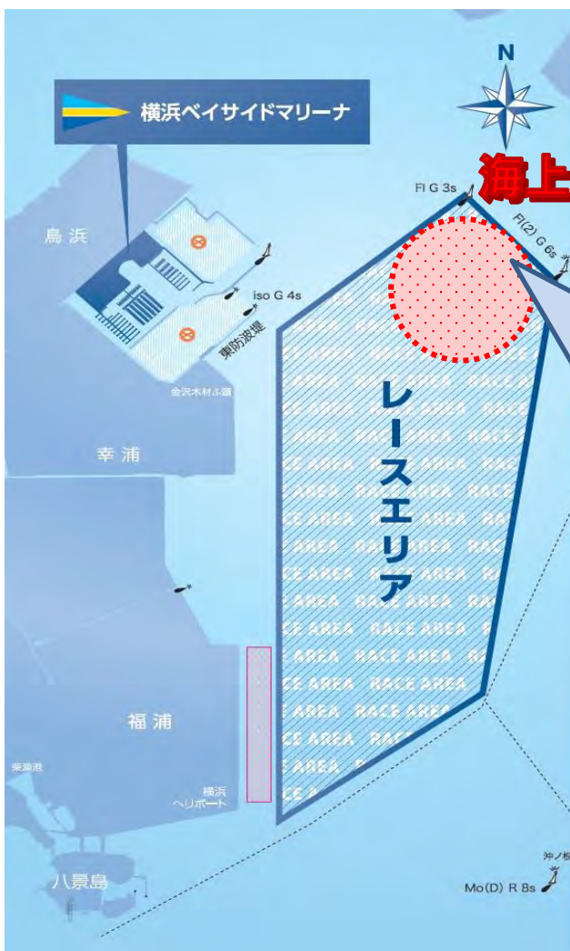
添付図2 「レース・エリア」